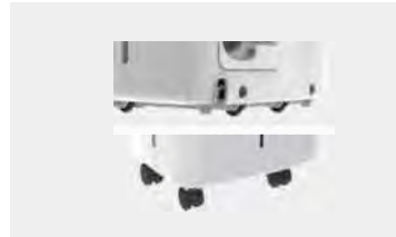
Ροδάκια για εύκολη μετακίνηση