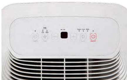
Panel Αφυγραντήρα MDDF-20DEN7-QA3