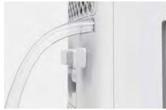
Δυνατότητα συνεχής αποστράγγισης νερού με σωληνάκι