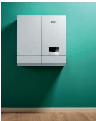
ecoTEC plus με ταμειυτήρα uniSTOR

Ο νέος επίπεδος σχεδιασμός και η ευκολία στον χειρισμό λειτουργίας του ecoTEC plus μέσω την νέας οθόνης αφής, καθιστούν την εγκατάσταση και τη λειτουργία του λέβητα ιδιαίτερα απλή. Η καθαρή δομή του μενού, ο επεξηγητικός βοηθός εγκατάστασης και το κείμενο στα ελληνικά διευκολύνουν την πλοήγηση.