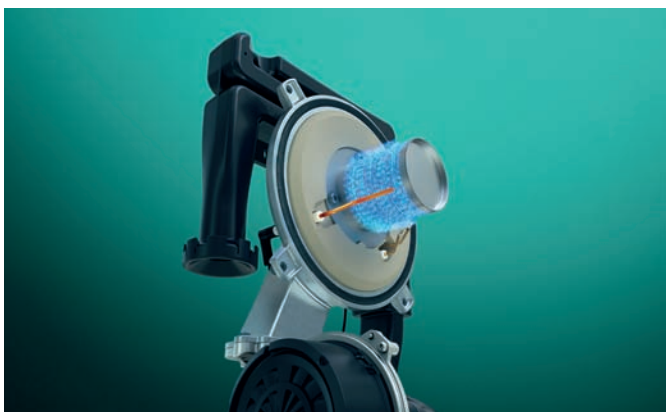
Βαλβίδα αερίου IoniDetect

Ο νέος ecoTEC plus: Ο ευέλικτος λέβητας για κάθε σπίτι με την πιο σύγχρονη και δοκιμασμένη τεχνολογία.